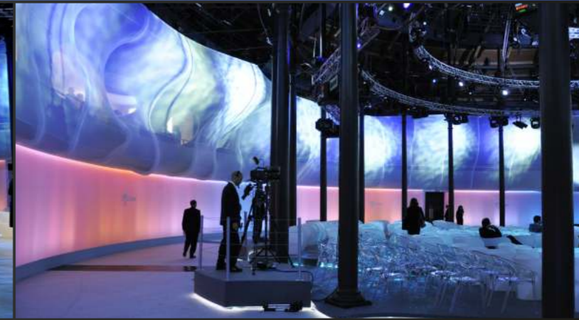
ENEL 2010 RESULTS PRESENTATION Fish Market | Marzo 2011 | Londra, Regno Unito