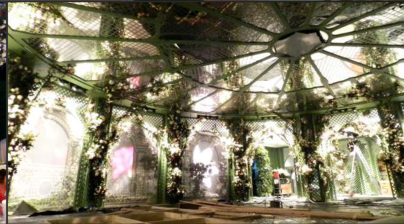
HEYDAR ALIYEV FOUNDATION GALA Heydar Aliyev Center | Maggio 2013 | Baku, Azerbaijan