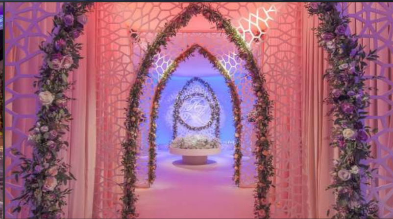
EVENTO PRIVATO Settembre 2016 | Baku, Azerbaijan