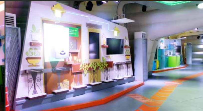
ENEL 5.0 Tour 2012 | Italia