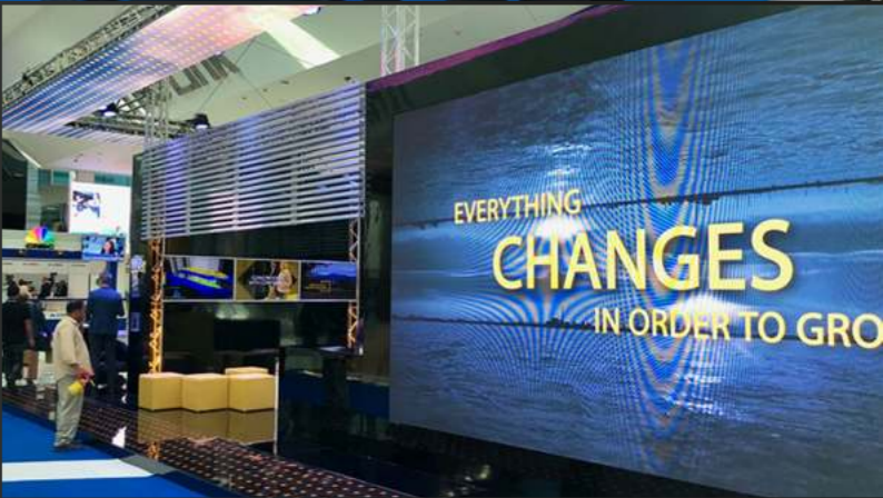
PLAYSTATION Games Week | Ottobre 2016 | Milano, Italia