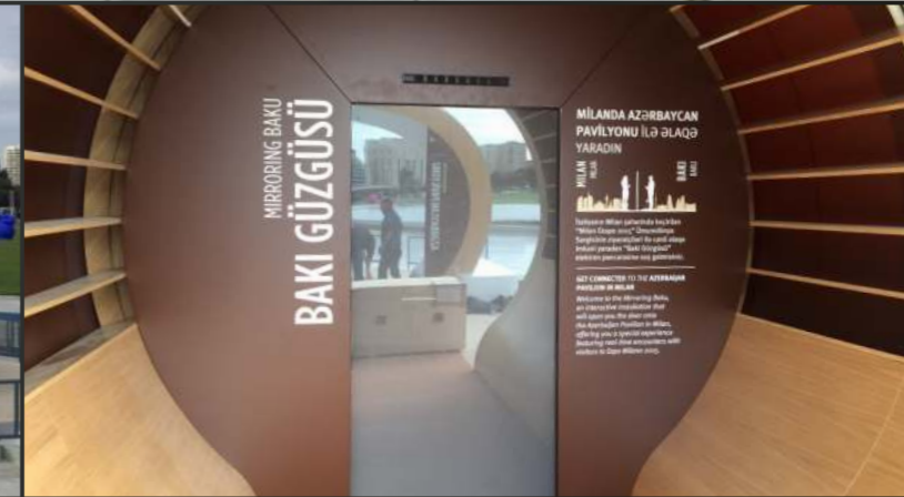
PADIGLIONE DELL'AZERBAIJAN Expo 2015 | Maggio 2015 | Milano, Italia