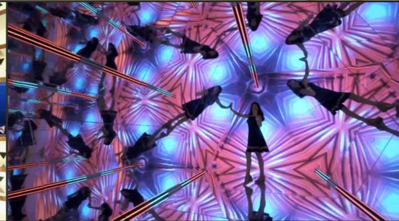
PADIGLIONE DEL PRINCIPATO DI MONACO Expo 2017 | Giugno 2017 | Astana, Kazakistan